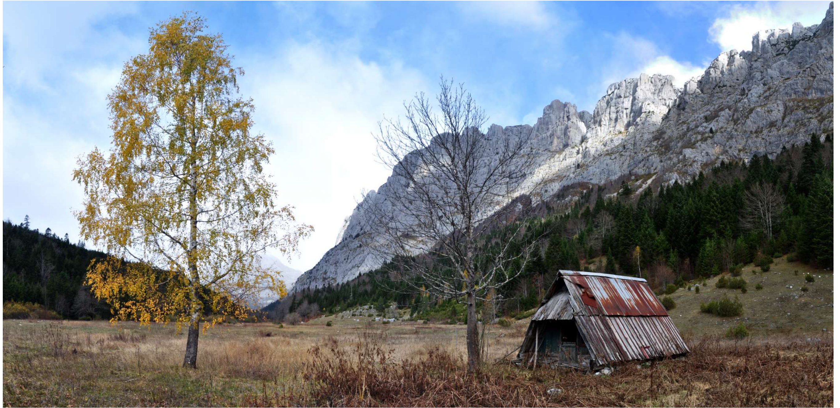
Boljske grede, kanjon Komarnice