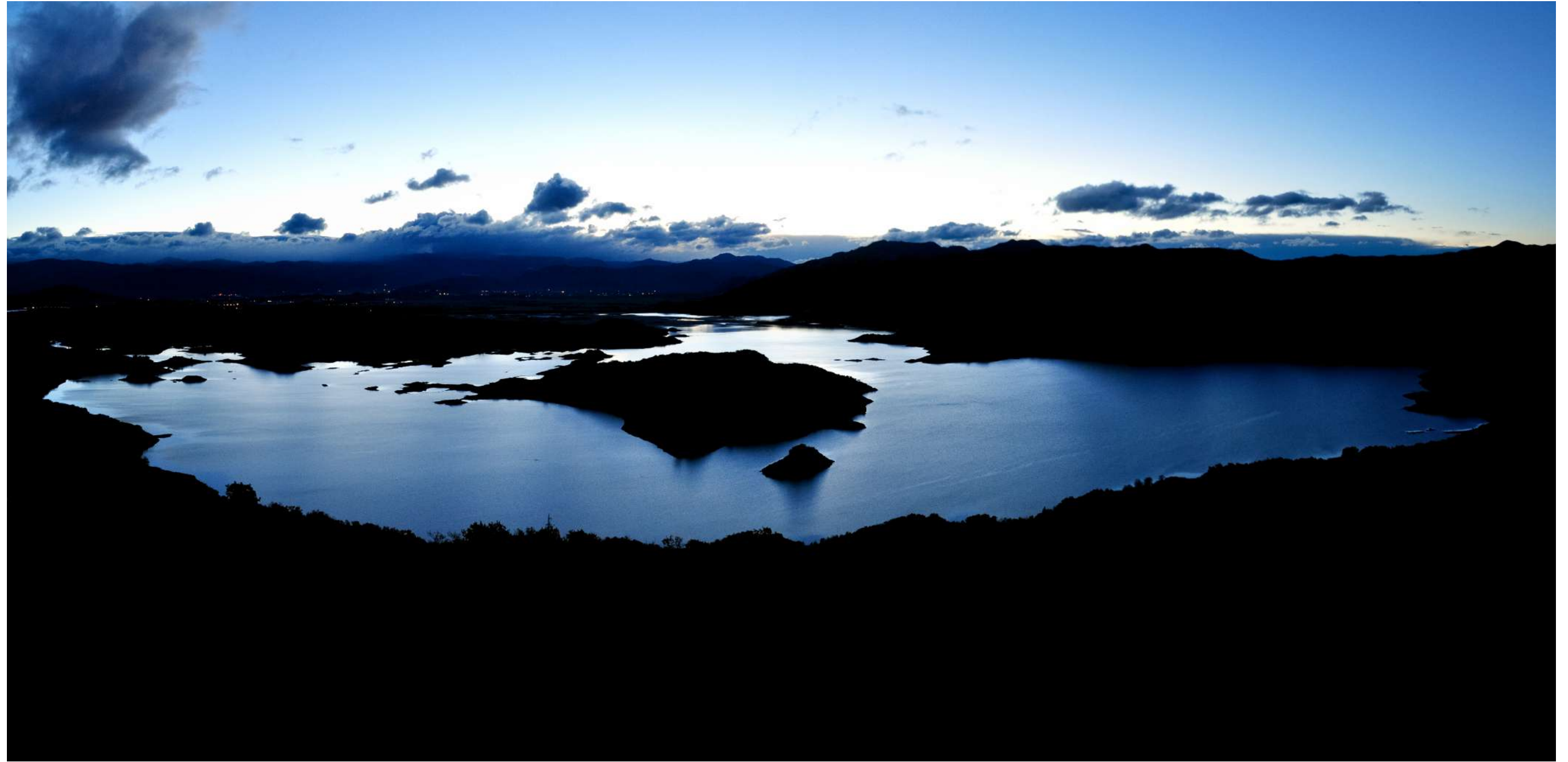
Jezero Slano, Nikšić