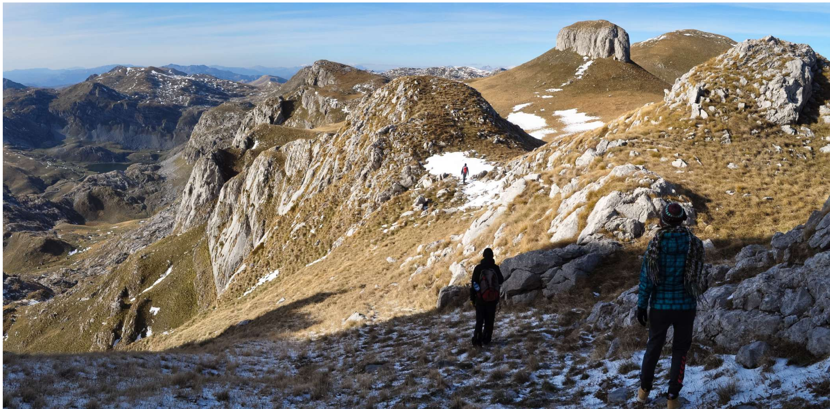
Stožac, Moračke planine