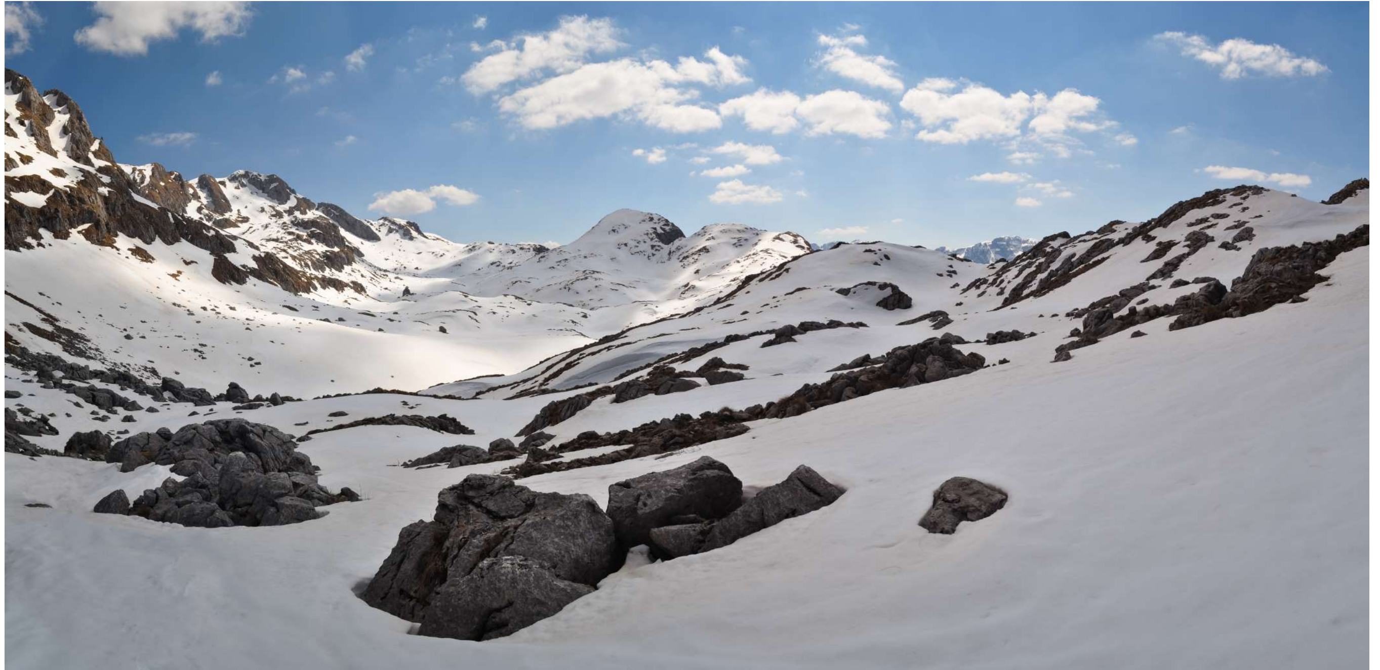
Stožac, Moračke planine