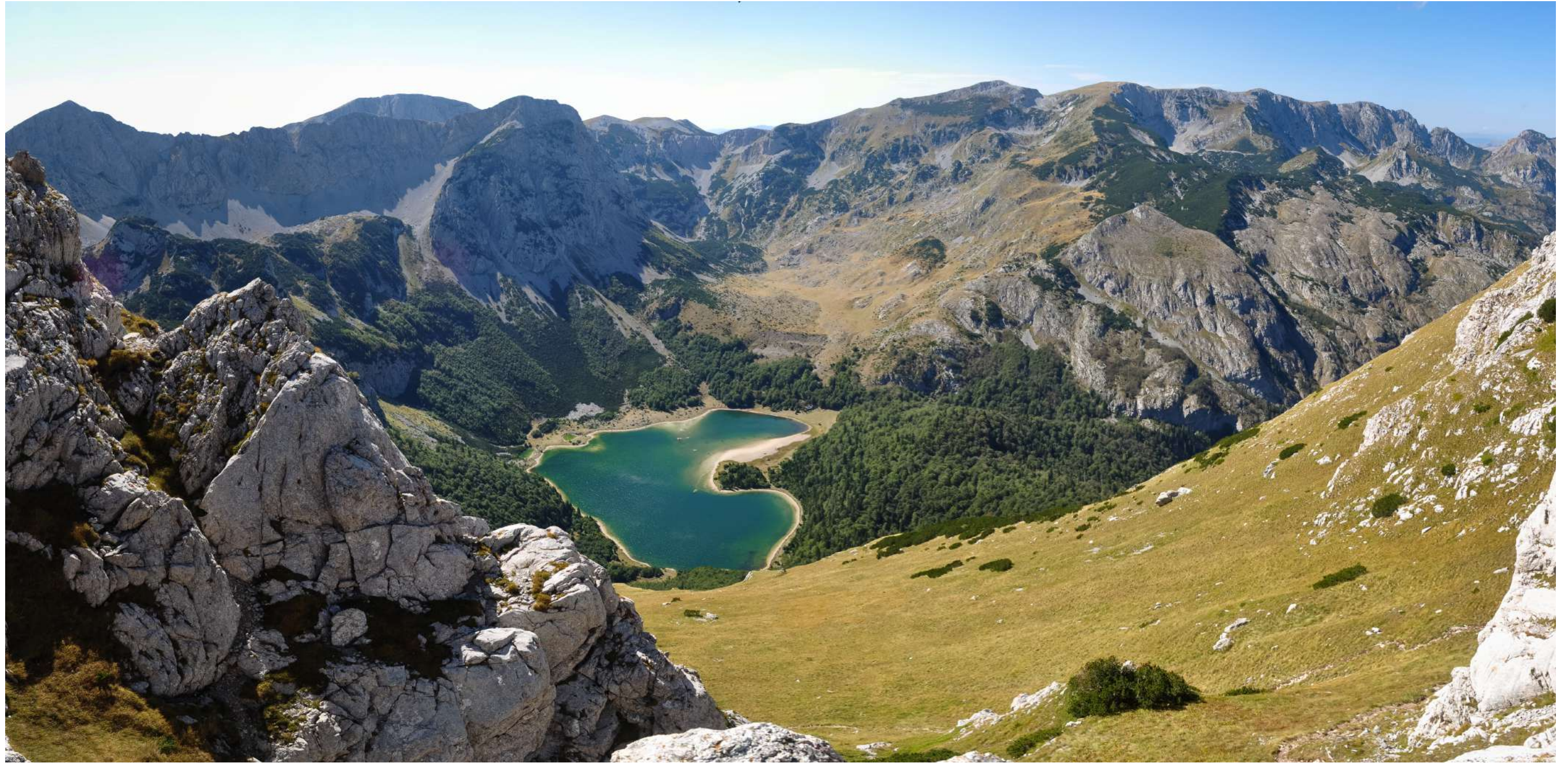
Trnovačko jezero, Pivske planine