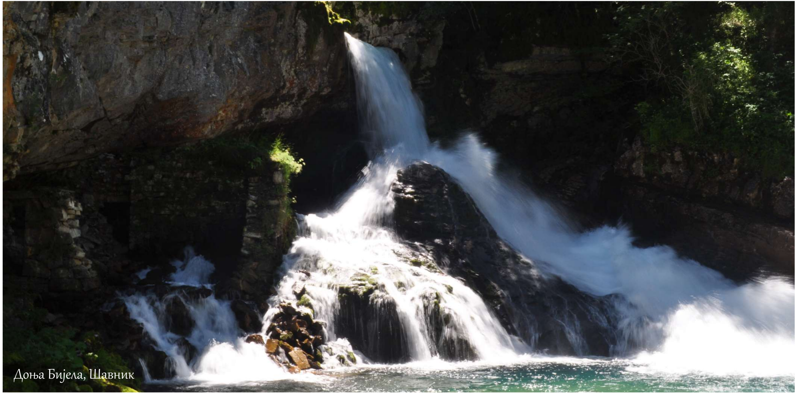
Доња Бијела, Шавник