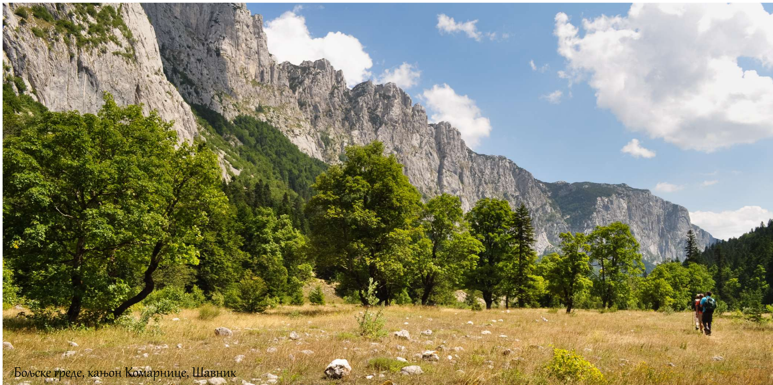
Бољске греде, кањон Комарнице, Шавник