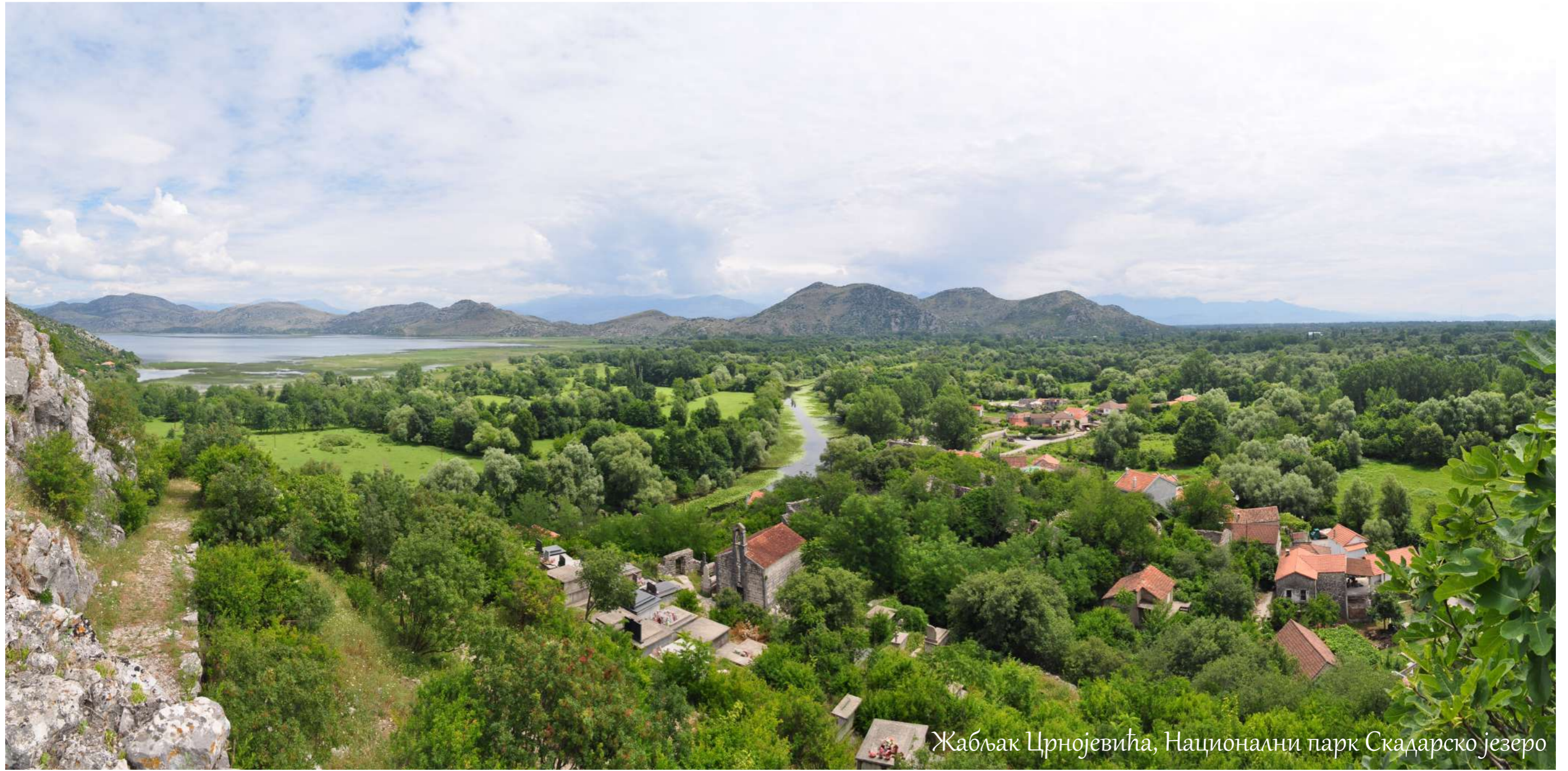
Жабљак Црнојевића, Национални парк Скадарско језеро