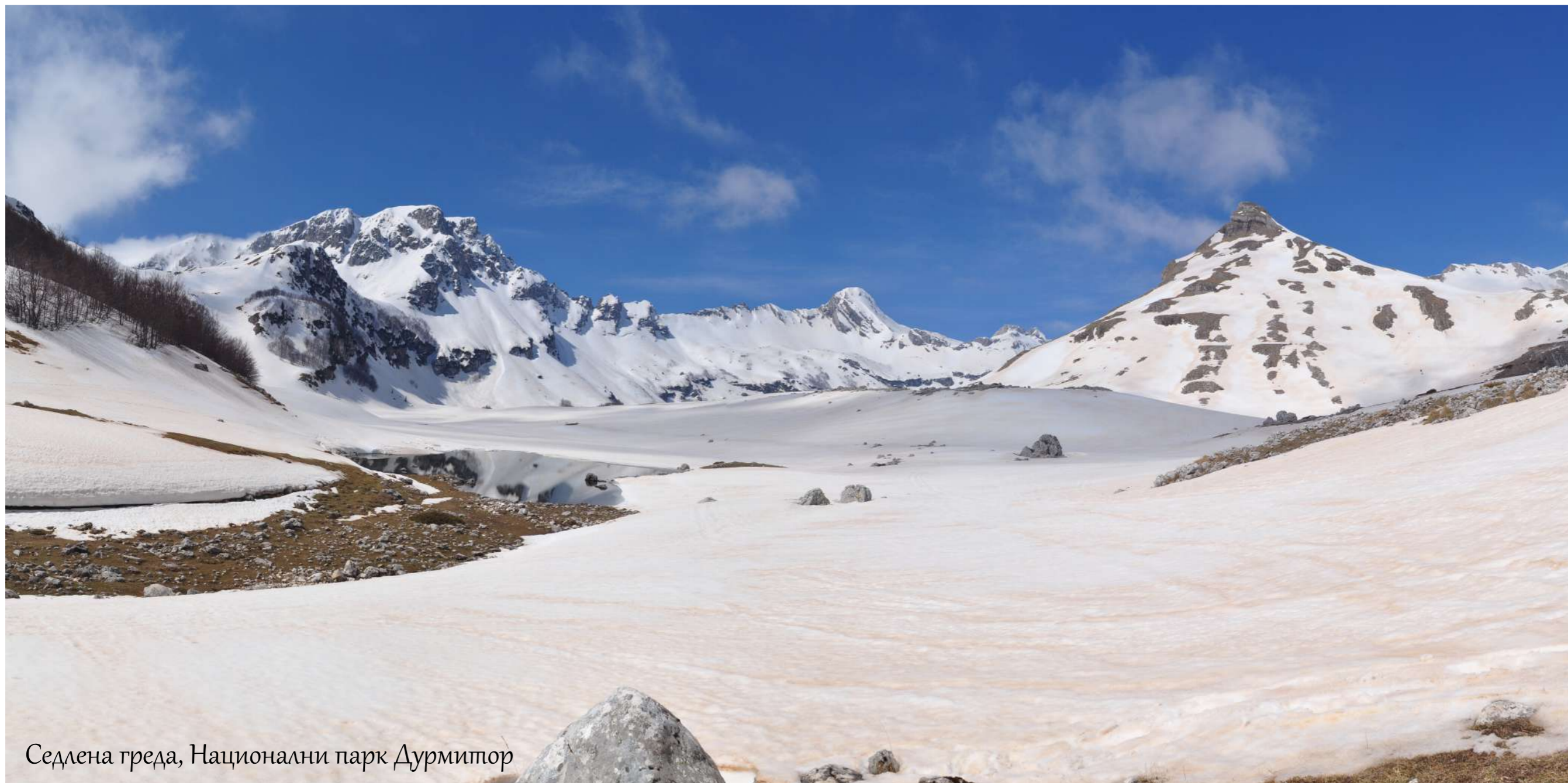
Седлена греда, Национални парк Дурмитор