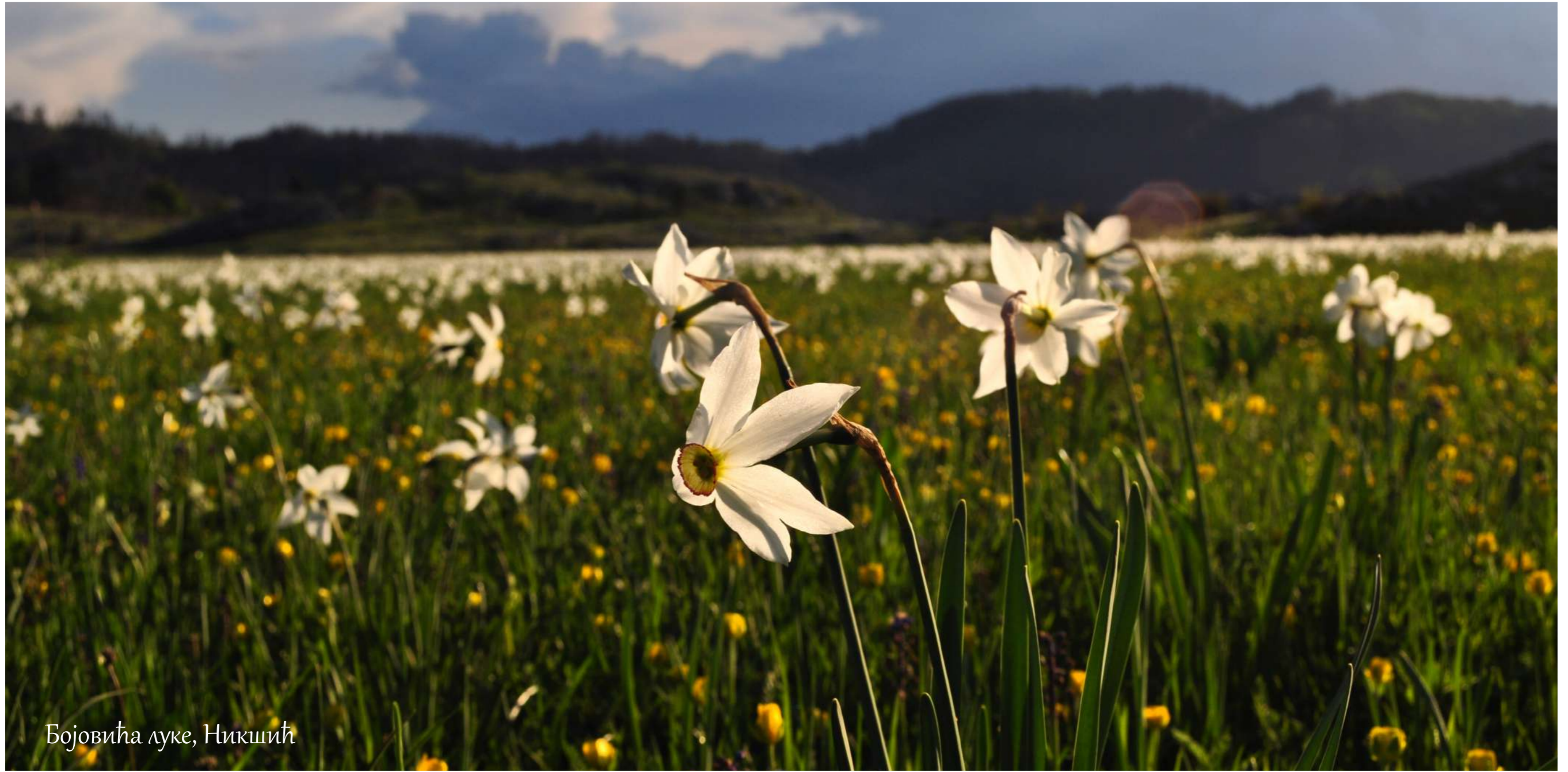
Бојовића луке, Никшић