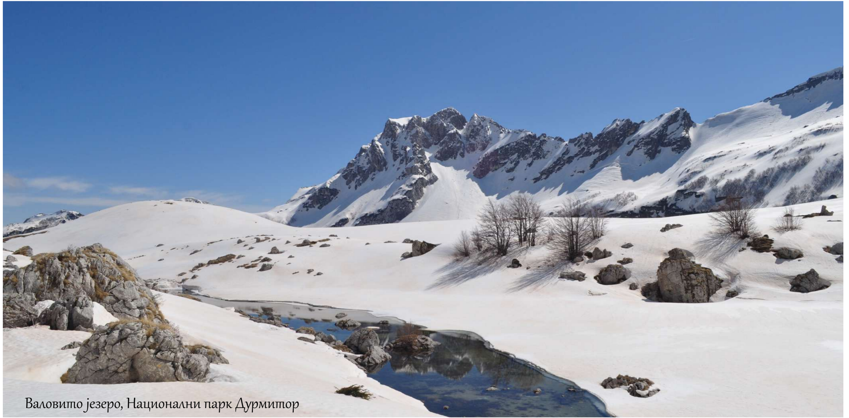
Валовито језеро, Национални парк Дурмитор