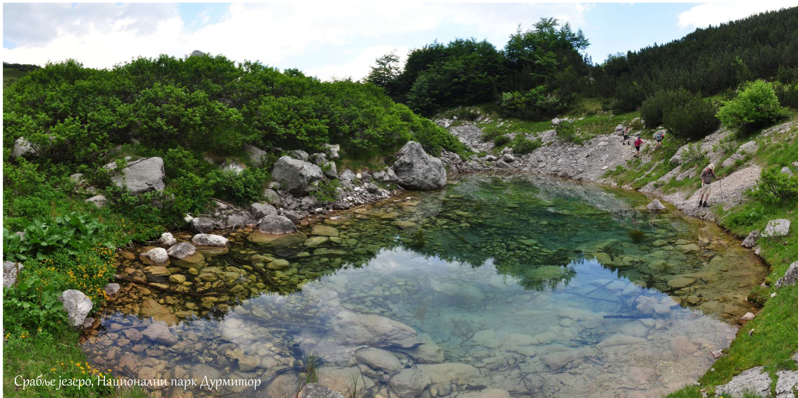
Срабље језеро, Национални парк Дурмитор